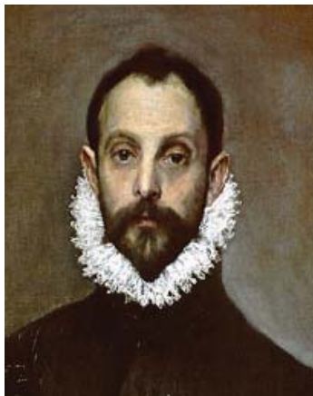
El Greco. El caballero de la mano en el pecho . Circa 1578 (fragmento).