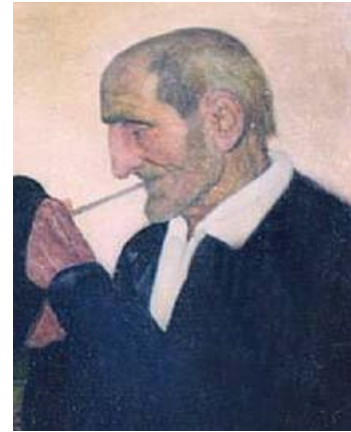
Ramón de Zubiaurre. Personaje con pipa (fragmento)