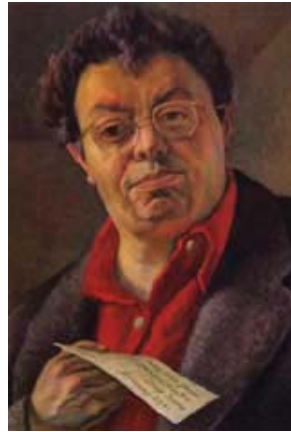
Diego Rivera. Autorretrato . 1941