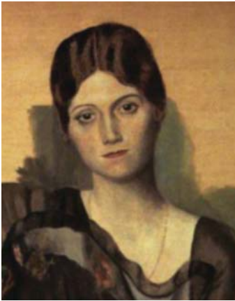
Pablo Ruiz Picasso. Retrato de Olga en un sillón . 1917 (fragmento)

4. Mira estos cuadros. Lee la descripción que aparece más abajo y averigua a qué pintura pertenecen. Fíjate en el vocabulario que has aprendido en el ejercicio anterior. Las pinturas te ayudarán a entender las palabras que no hayas podido descifrar en el ejercicio anterior.