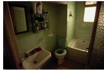
Baño Cuarto de baño