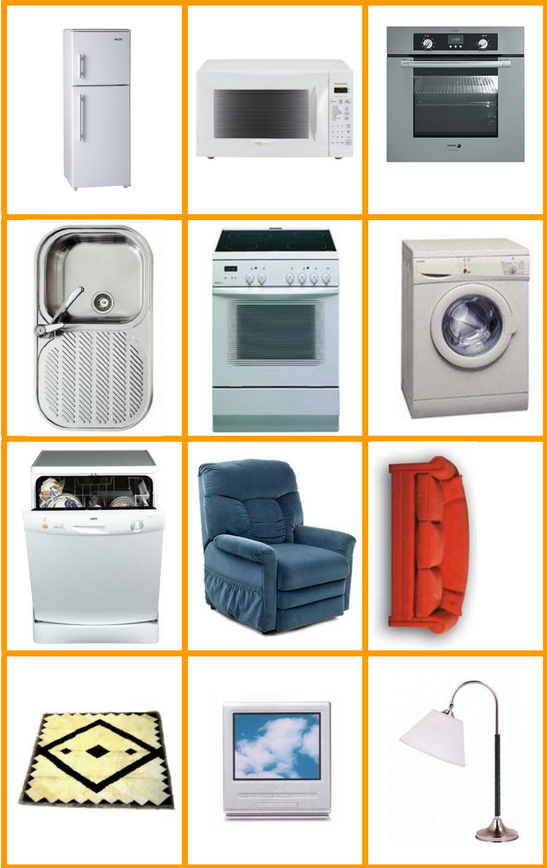
CÍRCULO DE TARJETAS