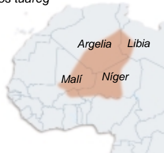
Distribución geográfica de los tuareg

Los principales pueblos de África del norte hablan el árabe y pertenecen al grupo de los caucasoides, entre los que se engloban los bereberes y los árabes. Los habitantes del desierto viven como nómadas y se visten con ropa suelta, turbante, chilaba y chal, para mantenerse frescos y protegerse de la arena. Además, los tuareg se resistieron durante largo tiempo a la colonización.