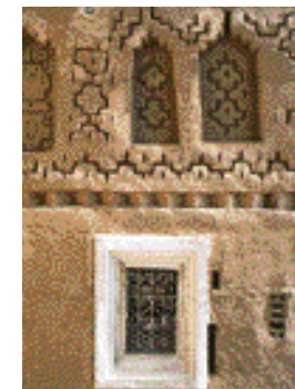
Un país de puertas y celosías.

ham. El mejor lugar para contemplar la plaza es la terraza del Café de Francia . Si decides avanzar hacia el interior, contemplarás fiestas tan increíbles como la de las Rosas, que se celebra durante el mes mayo en el valle del Dadés. Espectaculares las gargantas del Todra. Erfoud es conocida por la calidad de sus dátiles y en Rissani sería imperdonable no contemplar un amanecer en las dunas. Zagora supone la puerta del Sahara y punto de partida de caravanas durante siglos. Politours. Cuatro días. Incluye Agadir.