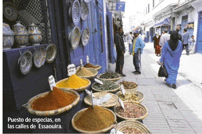
Puesto de especias, en las calles de Essaouira.