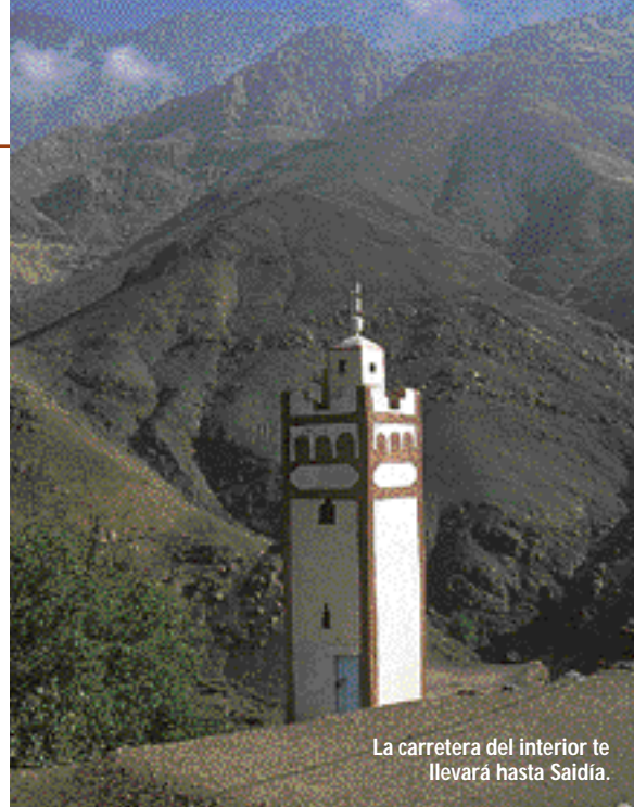
La carretera del interior te llevará hasta Saidia.

Marruecos, país de puertas y celosías, tiene puertas para todo: para África, para el norte y para el sur, para el mar y la montaña. Chaouen o Chefchaouen no podía ser menos, es la frontera con el agreste Rif. Enjalbegada de blanco y añil, se derrama por una escarpada ladera que va a parar a un animado zoco y a una plaza presidida por un gigantesco cedro. El Parador de Turismo (Plaza de El Makhzen. ☎ 98 63 24/61 36), de 4 estrellas, heredero de los tiempos españoles, completamente remozado y que da un excelente servicio. El hotel Asma , (Sidi Abdel Hamid. ☎ 98 62 65/60 02), de tres estrellas, es una estupenda opción.