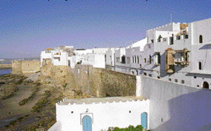
Asila (foto) se encuentra a pocos km de Tánger. Si tienes tiempo, entra en un restaurante y pide baisara , un tazón de puré de guisantes secos aderezado con comino y un chorreón de aceite.

occidentales. Otra excursión que puede hacerse es al Cabo Malabata , la carretera que bordea la costa hasta Ceuta está llena de calas desiertas. Tetuán no tiene mar, ni falta que le hace, para eso tiene al lado Restinga . Ued Lahu , a 40 kilómetros al Oeste, es un pueblo costero que se está poniendo de moda. En Castillejo hay un animado zoco que da a una playa de arena blanca.