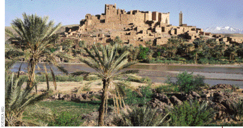
Tifoultout, en el valle del Ouarzazate.

Agadir , paraíso turístico de primer orden en el que es fácil encontrar a personajes como Sarah Ferguson, es una ciudad limpia y cuidada, completamente reconstruida tras el terremoto de 1960. Las gigantescas palabras en árabe que cubren el monte cercano y que se ven desde la playa dicen: Alá, Al Uatán, Al Malik (Dios, Patria, Rey). Un consejo: cuidado con el sol, es muy fuerte. Los mejores hoteles son La Kasbah (☎ 84 01 36), Safir Europa (☎ 82 12 12) y Les Almohades (☎ 84 02 33), los tres en el Boulevard du 20 Aout. El Beach Club tiene mucha marcha nocturna en su discoteca. Visita la ciudad fortificada de Essaouira.