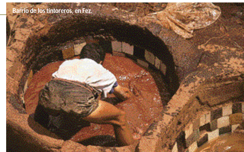
Barrio de los tintoreros, en Fez.

Si posees un olfato delicado, antes de ir al barrio de los tintoreros de Fez, ponte en la nariz un poco de vaselina perfumada y no vayas ni completamente en ayunas ni después de haber comido. Aún así, merece la pena visitar este lugar que bien pudiera haber servido de base a Dante en su descripción de los círculos del infierno.